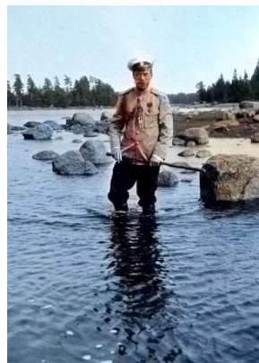
A cár a víz megszálottja volt