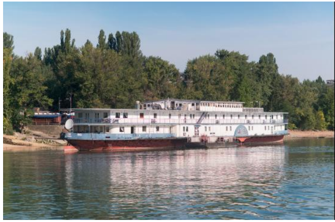
Az Aquamarina Hotel a Rómaifürdő Hajóállomásánál

Kevesen tudják, hogy a Romanov-család hajója most a Római-parton van rekonstruált állapotban: ez az Aquamarina Hotel.