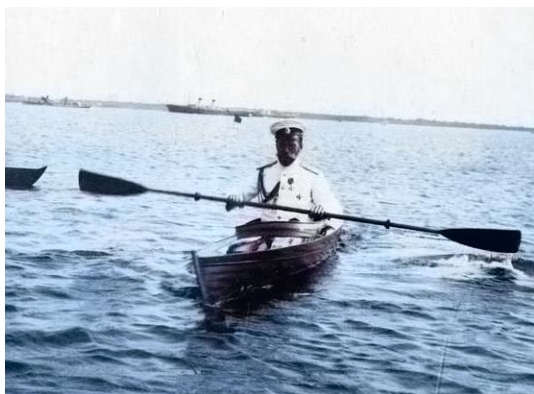
II Miklós cár