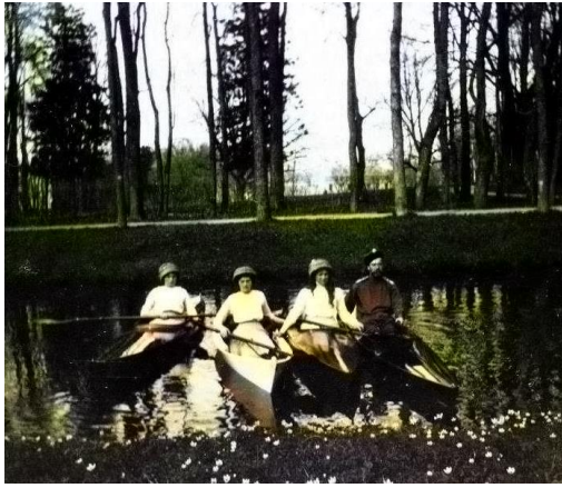
A cári család egy csatornán kirándul