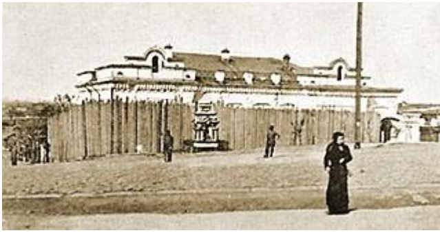
Az Ipatyev ház

A városban egy gazdag mérnök, Ipatyev villáját foglalták le a cári család, valamint a melléjük rendelt bolsevik őrség számára. A cári családot házi orvosuk, két komorna, és II. Miklós inasa is elkísérték, önként vállalva volt gazdáikkal a fogságot.