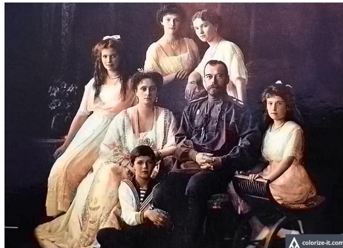
A cári család (Az eredeti fekete- fehér kép színezve a Colorize-it szoftverrel)