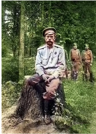
A cár és testőrei