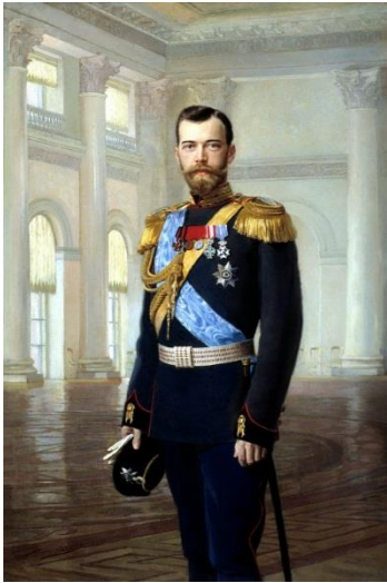
A cár (Earnest Lippart festménye)