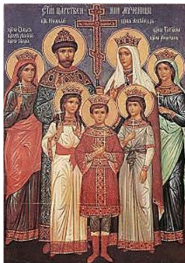
A szent cári család

1998-ban, a gyilkosság 80. évfordulóján a csontokat ünnepélyes pravoszláv szertartás keretei között a szentpétervári Szent Péter és Pál székesegyházban temették el. Az orosz ortodox egyház szinódusa 2000-ben szentté nyilvánította II. Miklóst és családtagjait.