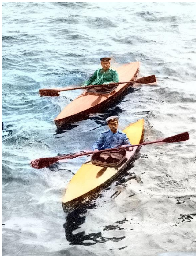
II. Miklós cár Finnországban, testőrével kajakozik