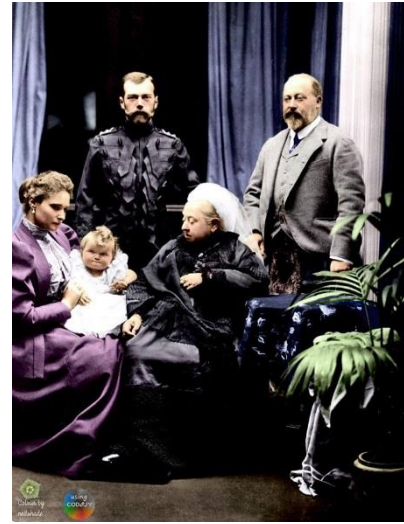
A cári család (Az eredeti fekete- fehér kép színezve a Codijy szoftverrel)