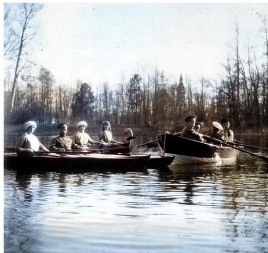
A cári család közös kajak-kiránduláson

II. Miklós 1905-ben édesanyjának írt levelében azt mondta, hogy amíg Szent-pétervárott állandóan a terroristáktól kell tartania, Finnországban valóban el tud lazulni. Uralkodása alatt több mint 300 napot töltött Finnországban, s sokszor a Standart nevű yachtján kirándult, de számos alkalommal kajakozott is, és ebben a sportban családjának több tagja is részt vett.